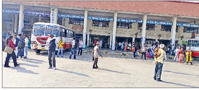
जींद। बस अड्डा पर परेशान यात्री।

प्रकोशोत्सव के उपलक्ष्य में 79वां वार्षिक धार्मिक दीवान कार्यक्रम का आयोजन किया गया था। शहर में श्रद्धालुओं की सुरक्षा को मध्यनजर रखते हुए हांसी, नरवाना व असंध रूट पर चलने वाली परिवहन समिति की बसों को भी बस स्टैंड से फ्लाईओवर से होते हुए भेजा गया। जबकि अन्य दिनों में हांसी, असंध व नरवाना रूट की बसें बस स्टैंड से चल कर गोहाना रोड होते हुए लघु सचिवालय, नागरिक अस्पताल पुराना बस स्टैंड, एसडी स्कूल, रुपया चौक, सब्जी मंडी मोड़ होते हुए पटियाला चौक से निकलती हैं। इससे पहले भी 14 नवंबर को राई में