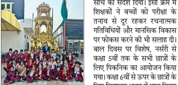
हिसार। महारानी लक्ष्मी बाई त्रिलोकचंद स्कूल में आयोजित बाल दिवस कार्यक्रम में बच्चे व अध्यापकगण।

महारानी लक्ष्मी बाई त्रिलोकचंद स्कूल, भिवानी रोहिल्ला में 14 नवंबर को बाल दिवस उत्साह एवं उमंग के साथ मनाया गया। इस दिन की शुरुआत विद्यालय के प्रांगण में आयोजित विशेष प्रार्थना सभा से हुई, जिसमें समस्त छात्र-छात्राएं और शिक्षकों ने सहभागिता निभाई। बच्चों को बाल दिवस के महत्व पर प्रकाश डालते हुए अध्यापकों ने पंडित जवाहरलाल नेहरू का स्मरण किया और उन्हें बच्चों के प्रिय 'चाचा नेहरू' संबोधन से याद