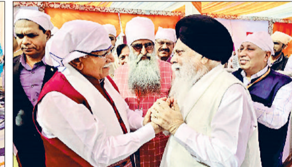
जींद। कार्यक्रम में केंद्रीय ऊर्जा मंत्री मनोहरलाल को उनका चित्र भेंट करते हुए।