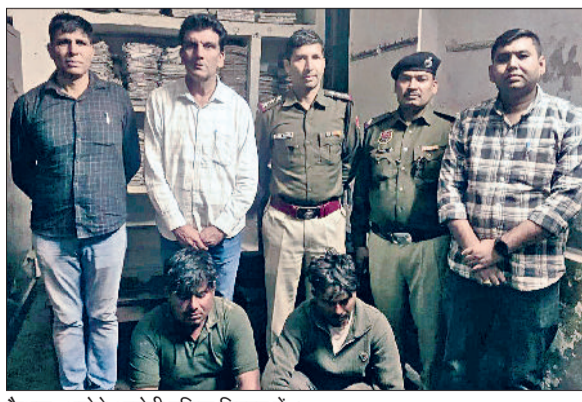
कैथल। भगोड़े आरोपी पुलिस गिरफ्तार में।