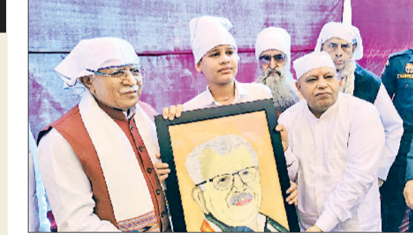
जींद। कार्यक्रम में केंद्रीय ऊर्जा मंत्री मनोहरलाल को उनका चित्र भेंट करते हुए।

केंद्रीय ऊर्जा मंत्री मनोहरलाल ने कहा कि बहुत प्रसन्नता की बात है कि बाबा बंदा सिंह बहादुर का 79वां वार्षिक धार्मिक दीवान जींद में आयोजित किया गया है। जो पिछले काफी सालों से इस सम्मेलन में शिरकत करते हैं। बाबा बंदा सिंह बहादुर की जो शिक्षाएं हैं, जो समाज के लिए उनकी देन है, उससे हमें प्रेरणा मिलती है। वो अगली पीढ़ी, नौजवानों से आह्वान करते हैं कि वो बाबा बंदा सिंह बहादुर के दिखाने रास्ते पर चलें। बाबा बंदा सिंह बहादुर की शिक्षाओं को अपने जीवन में उतारें। बाबा बंदा सिंह बहादुर ने देश के लिए शहादत दी। संत परमपरा के नाते उन्होंने समाज को नई दिशा दी। उन्होंने उस समय जमींदार शासकों को समाप्त किया। हम भी उनसे प्रेरणा लेकर आगे बढ़ रहे हैं। केंद्रीय ऊर्जा मंत्री मनोहरलाल ने पत्रकारों से बातचीत में कहा कि बाबा बंदा सिंह बहादुर की प्रेरणा से ही हरियाणा प्रदेश की साढ़े नौ वर्ष तक सेवा करने का मौका मिला। हमारी सरकार ने भी ऐसी बहुत सी जमीनों को विभाजन के बाद लोगों को दी गई थी, उनका मालिकाना हक दिया। बाकयादव इसके लिए कानून बनाया गया।