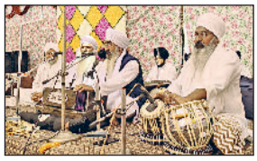
हिसार। प्रकाशोत्सव पर कीर्तन करते हुए रागी जलया।