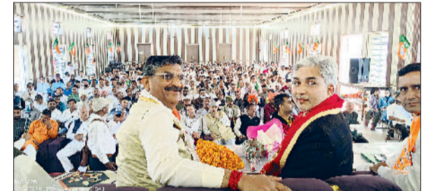
नरवाना। कार्यक्रम में मंच पर मौजूद कैबिनेट मंत्री कृष्ण बेदी।

भवन में आयोजित प्रबुद्धजन सम्मेलन को बतौर मुख्यअतिथि संबोधित कर रहे थे। यह सम्मेलन आत्मनिर्भर भारत अभियान के तहत हर घर स्वदेशी, घर-घर स्वदेशी की अवधारणा को जन-जन तक पहुंचाने के उद्देश्य से आयोजित किया गया था। मंत्री ने कहा कि प्रधानमंत्री द्वारा शुरू की गई स्वदेशी