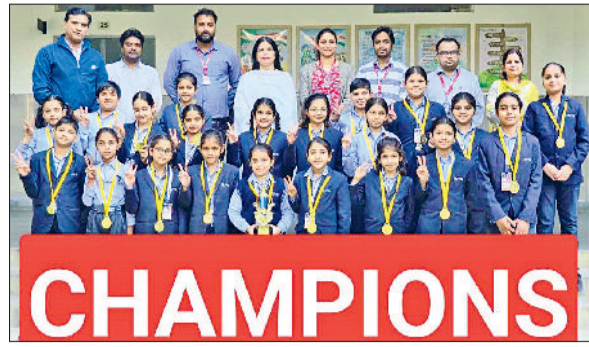
महेंद्रगढ़। खुशी जाहिर करते हुए।

पहचान मजबूत कर रहा है। यह हम सबके लिए गौरव की बात है। उन्होंने खिलाड़ियों को आने वाली प्रतियोगिताओं के लिए शुभकामनाएं दीं। प्रो. आशीष अग्रवाल ने बताया कि महिला वर्ग की टेबल टेनिस प्रतियोगिता में दयानंद महाविद्यालय हिसार द्वितीय तथा राजकीय महाविद्यालय हिसार