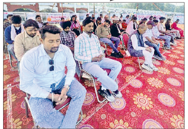
नारायण पिरामिड ध्यान केंद्र ने लगाया शिविर