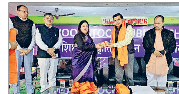
जींद। कार्यक्रम में मुख्यअतिथि को स्मृति चिन्ह देते हुए।