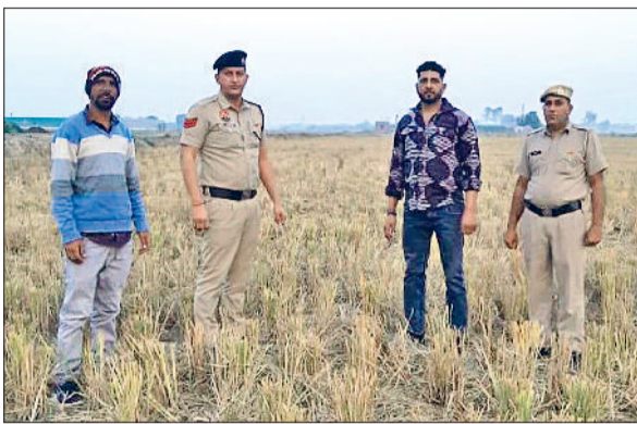
कैथल। खेतों में पराली न जलाने का आह्वान करते पुलिस कर्मचारी।